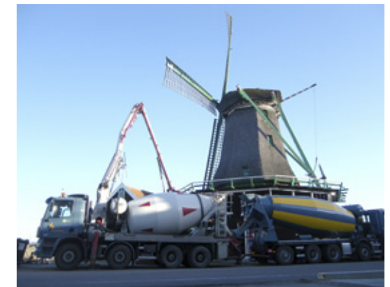
Daar komen de betonmortelwagens aan...

Omdat de molen uit een onder- en boven-achtkant bestaat, kan het onderchtkant niet te veel rechtgezet worden, want dan gaat het bovenchtkant mee en komt de kap schuin te staan, met als resultaat dat de molen bijna niet meer op de wind te zetten valt! Het hele maalwerk zal bijna 20 cm worden verplaatst, zodat het onderchtkant niet te veel rechtgezet hoeft te worden. Het maalwerk zal dan meteen worden afgesteld.