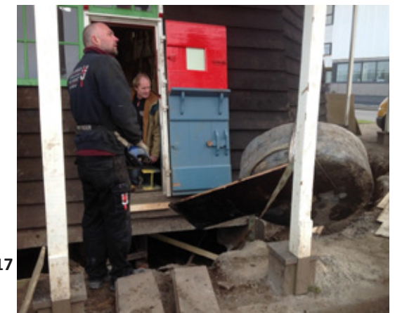
Het kleine opgegraven kantsteentje...